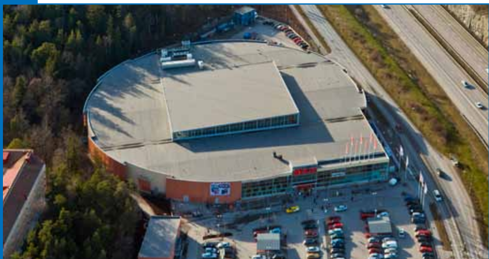
Ica Maxi, Stockholm